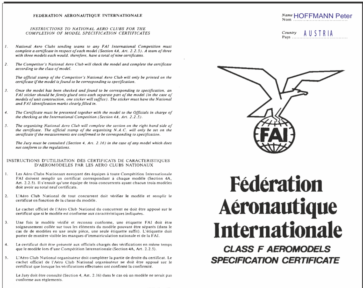
Abbildung -2 Model Specification Certificate Vorderseite

Teilnehmer von WM oder EM müssen noch das entsprechende "Model Specification Certificate" der FAI ausgefüllt zur Bauprüfung vorlegen. Dieses ist vom Mannschaftsführer vorher zu kontrollieren!