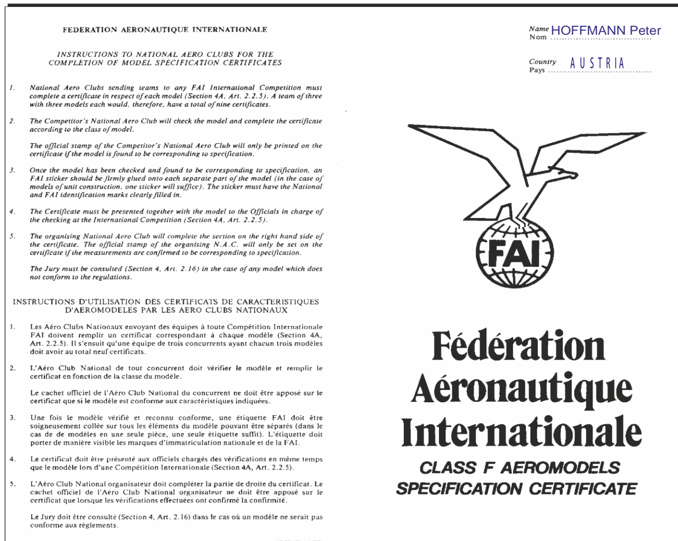
Abbildung -2 Model Specification Certificate Vorderseite

Teilnehmer von WM + EM müssen noch das entsprechende "Model Specification Certificate" der FAI ausgefüllt zur Bauprüfung vorlegen. Dieses ist vom Mannschaftsführer vorher zu kontrollieren!