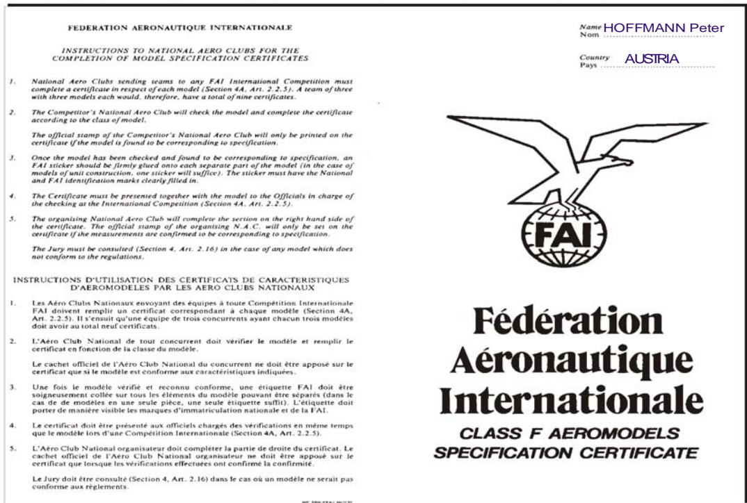
Abbildung -2 Model Specification Certificate Vorderseite

Teilnehmer von WM + EM müssen noch das entsprechende "Model Specification Certificate" der FAI ausgefüllt zur Bauprüfung vorlegen. Dieses ist vom Mannschaftsführer vorher zu kontrollieren!