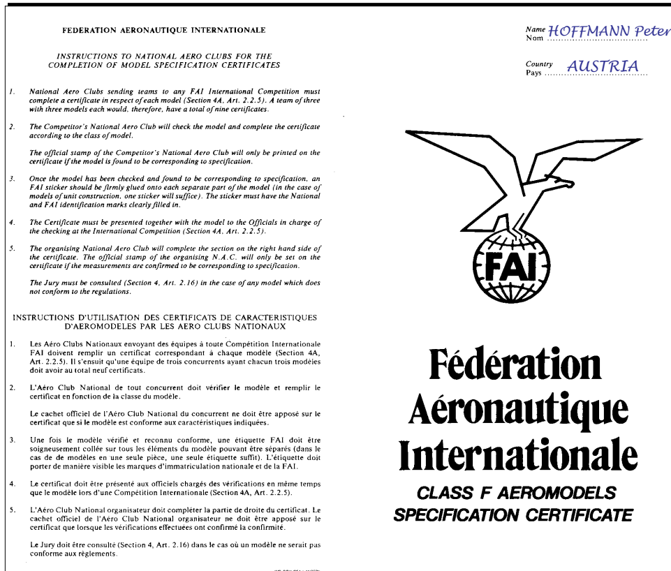
Abbildung 1 "Model Specification Certificate" - Vorderseite